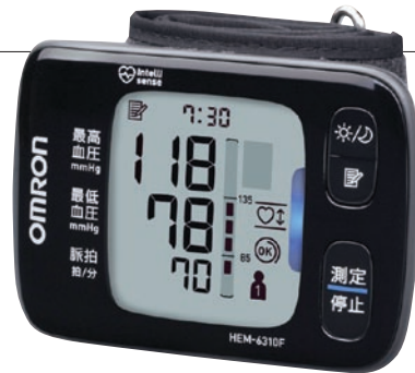
手首式自動血圧計 HEM-6310F

オムロン ヘルスケア お客様サービスセンター Tel.0120-30-6606 http://www.healthcare.omron.co.jp/